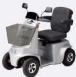
スーパーシルバー